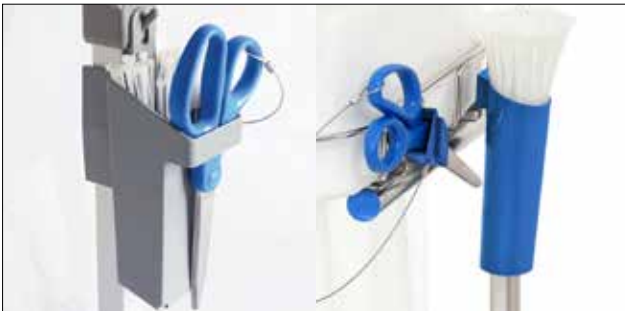
Kabelbinderhalter für Longopac Stand Classic Standard, grau. Item no. 30410 Metalldetektierbar, blau. Item no. 30416

Die Umrandung fixiert den Sack in seiner Position.