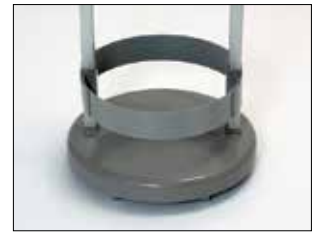
Umrandung für Longopac Stand Classic Mini Item no. 33890

Die Umrandung fixiert den Sack in seiner Position.