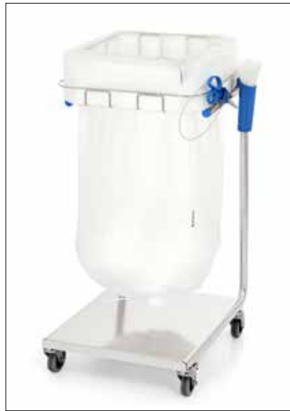
Stand Dynamic Midi/Midi Pedal