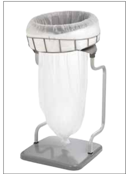
Stand Classic Recycling