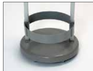
Umrandung für Longopac Stand Classic Mini Item no. 33890

Die Umrandung fixiert den Sack in seiner Position.