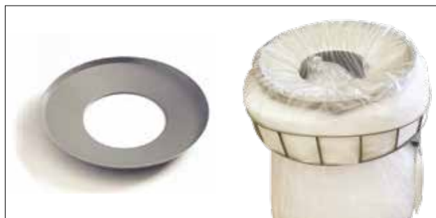
Lochscheibe für Longopac Stand Classic Maxi Item no. 30170

Kabelbinderhalter für Dynamic-Serie. Passend für Mini, Midi und Maxi Dynamic.