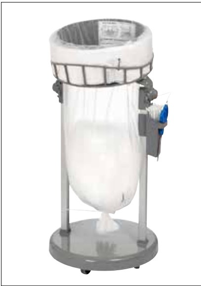
Stand Classic Mini/Mini Food