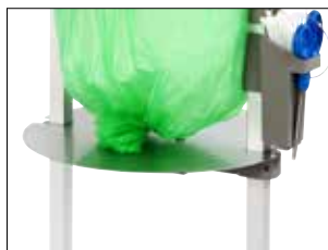
Verstellbare Platte für Stand Classic Mini Item no. 31480

Item no. 34609 Satz mit metalldetektierbarer Schere, Scherenhalter und Edelstahlbraht.