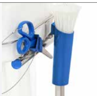
Kabelbinderhalter für Longopac Stand Dynamic Item no. 30410 (nur Halter)

Der Kabelbinderhalter beschleunigt Sackwechsel und hält die Kabelbinder an ihrem Platz. Passend zu Maxi und Mini, in zwei Ausführungen lieferbar.