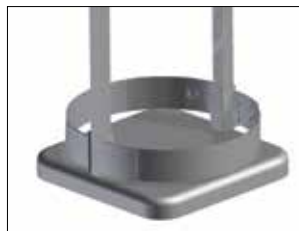
Umrandung für Longopac Stand Classic Maxi Item no. 33900

Zum einfachen und stabilen Verbinden mehrerer Longopac Stand-Einheiten. Auch Maxi und Mini lassen sich zusammenfügen.