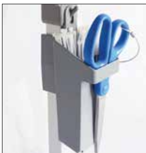
Kabelbinderhalter für Longopac Stand Classic Standard, grau. Item no. 30410 Metalldetektierbar, blau. Item no. 30416

Die Umrandung fixiert den Sack in seiner Position.