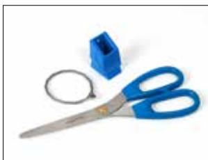
Scherensatz für Longopac Stand Dynamic, metall-detektierbar

Verkleinert die Einwurfföffnung und ermöglicht eine einfachere Komprimierung z.B. von Recyclingkunststoff. Nur für Maxi lieferbar.