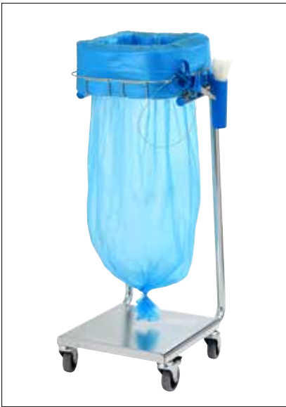
Stand Dynamic Mini/Mini Pedal