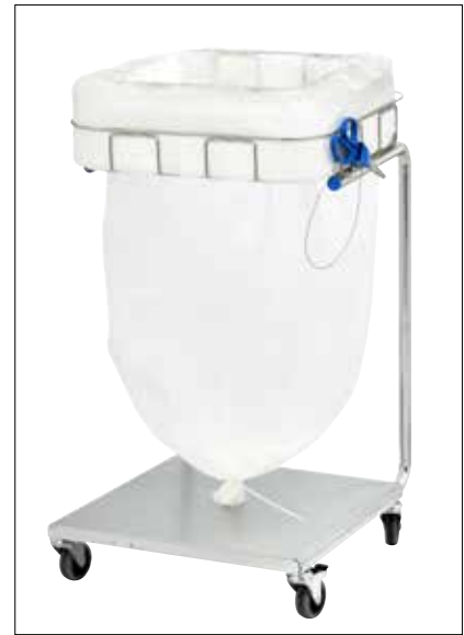
Stand Dynamic Maxi/Maxi Pedal