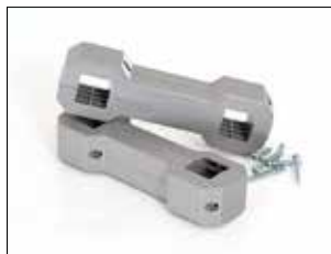
Ständeranschluss für Longopac Stand Classic Item no. 33750

Mini. Item no. 31140 Maxi. Item no. 30140