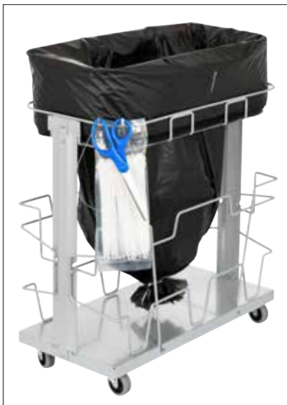
Stand Dynamic UBS