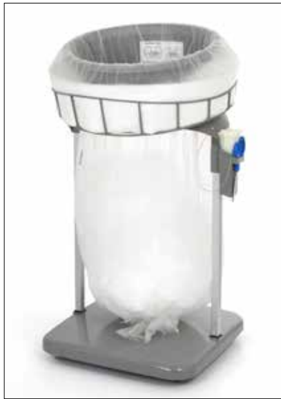
Stand Classic Maxi/Maxi Food