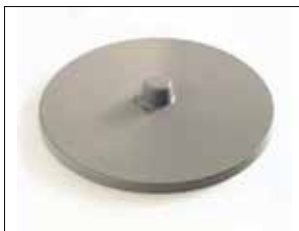
Deckel für Longopac Stand Classic Maxi und Mini

Mini. Item no. 31140 Maxi. Item no. 30140