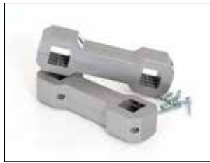
Ständeranschluss für Longopac Stand Classic Item no. 33750

Mini. Item no. 31140 Maxi. Item no. 30140