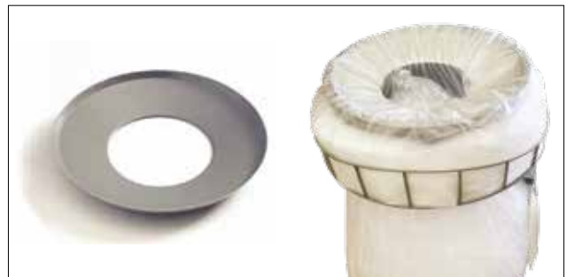
Lochscheibe für Longopac Stand Classic Maxi Item no. 30170

Verkleinert die Einwurfföffnung und ermöglicht eine einfachere Komprimierung z.B. von Recyclingkunststoff. Nur für Maxi lieferbar.