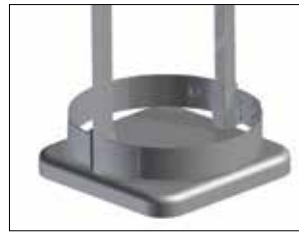
Umrandung für Longopac Stand Classic Maxi Item no. 33900

Zum einfachen und stabilen Verbinden mehrerer Longopac Stand-Einheiten. Auch Maxi und Mini lassen sich zusammenfügen.