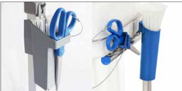
Kabelbinderhalter für Longopac Stand Classic Standard, grau. Item no. 30410 Metalldetektierbar, blau. Item no. 30416

Die Umrandung fixiert den Sack in seiner Position.