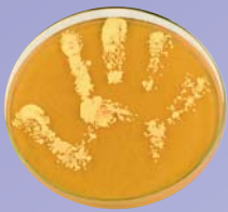
Handabklatsch ohne Seifenwaschung oder Desinfektion

Mit ihrer „Clean Care is Safer Care“-Initiative startete die WHO 2005 eine weltweite Kampagne für mehr Patientensicherheit. Im Mittelpunkt steht die Verbesserung der Händedesinfektion, da diese einen direkten Einfluss auf die Übertragung pathogener Erreger hat. Für dieses Ziel wurde das Konzept der „5 Momente der Händedesinfektion“ entwickelt (1).